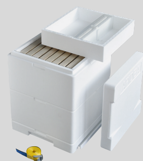
APIDEA Jungvolkkasten, CH-Mass